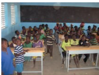
Fourniture de mobilier scolaire pour les trois classes de chaque école