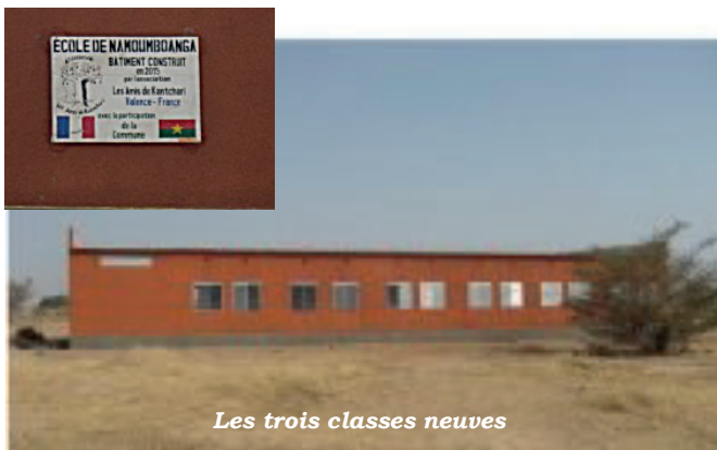
Les trois classes neuves