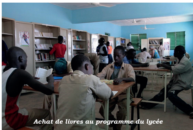
Achat de livres au programme du lycée